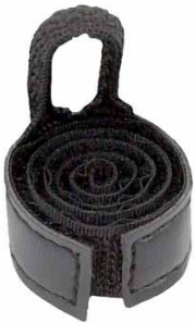
⑨ STB取付マジックテープ 品番 : 4907990801722 希望小売価格(税別) : ¥400