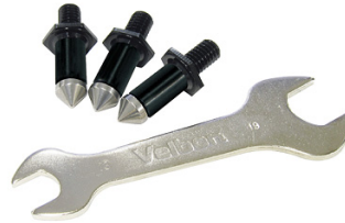
⑪ 30° 石突set ProGeoV600用 品番 : 4907990476937 希望小売価格(税別) : ¥2,950