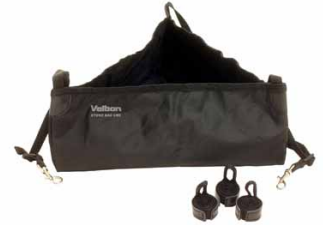
⑧ ストーンバッグCM6 品番 : 4907990800091 希望小売価格(税別) : ¥1,800