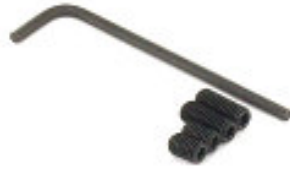
⑥ 雲台緩み防止ネジset CM6 品番 : 4907990802156 希望小売価格(税別) : ¥600