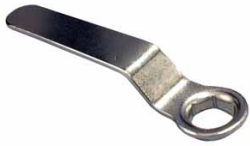
⑤ U3/8ソケットレンチ 品番 : 4907990802187 希望小売価格(税別) : ¥400