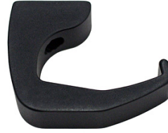
⑦ エンドフックDX 品番 : 4907990803368 希望小売価格(税別) : ¥1,200