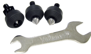
⑩ 可変石突set ProGeoV600用 品番 : 4907990476913 希望小売価格(税別) : ¥4,600