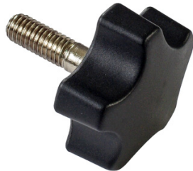
⑥ SHR300 II EVストッパー 品番 : 4907990804648 希望小売価格(税別) : ¥400