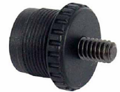
⑧ MAXiセンターエンド1/4 品番 : 4907990803610 希望小売価格(税別) : ¥300