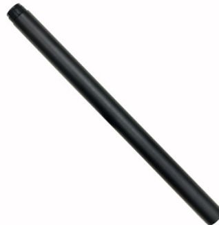
⑦ SHR300 II ロアークラム 品番 : 4907990804631 希望小売価格(税別) : ¥1,000