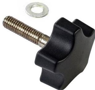
② P33Mパンストッパー 品番 : 4907990804594 希望小売価格(税別) : ¥600