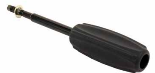
④ P33Mパンハンドル 品番 : 4907990804617 希望小売価格(税別) : ¥1,200