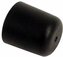
⑨ R10N3石突ゴム 品番 : 4907990800947 希望小売価格(税別) : ¥300