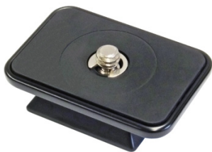
① QB-42 品番 : 4907990379795 希望小売価格(税別) : ¥2,600