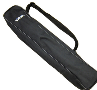
⑪ 付属ケースU4 品番 : 4907990803986 希望小売価格(税別) : ¥1,600