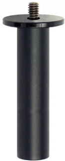
⑤ SHR300 II アッパーコラム 品番 : 4907990804624 希望小売価格(税別) : ¥1,400