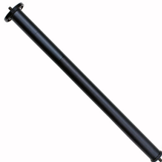
⑩ SHR345 II センター棒CP 品番 : 4907990804655 希望小売価格(税別) : ¥2,700