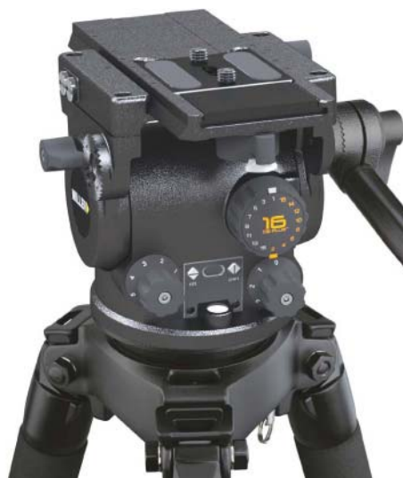
○トルクの切替とカウンターバランスの調整ダイヤルが手前に配置されているので、素早くヘッドのバランスを設定することができます。